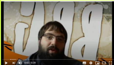
SARI BANAKETA ONLINE

Ikasturte honetan zehar ere "Bertsoa bizi gazte" egitasmoa eraman da aurrera Arabako eskola gehienetan. Egitasmo honen helburua bertsolaritza, rapa eta musika lantzea da. Instituto eta batxilergoko ikasleei zuzenduta dago. Gure kasuan Gasteizko DBH 3. eta 4. mailako ikasleek lau eta hiru ordutako tailerrak landu dituzte Xabier Lasarekin. Hauek izan dira aurten tailerra egin dugun ikastetxeak: Armentia, Ekialde, Herrandarrak, Ikasbidea, Olabide eta Zabalgana.