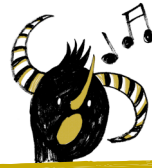
Peru Vidal Gurrutxaga