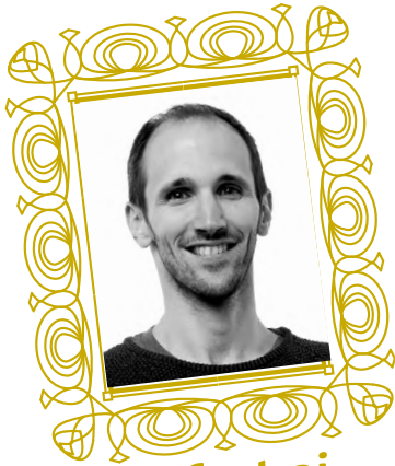
Sustrai Colina Akordarrementeria