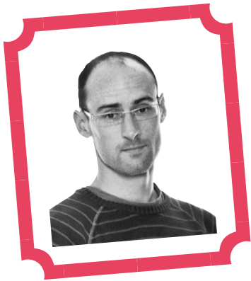
Amets Arzallus Antia